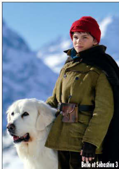
Belle et Sébastien 3