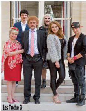
Les Tuche 3