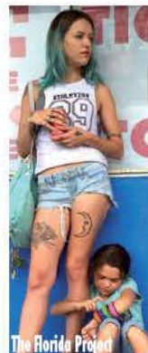
The Florida Project