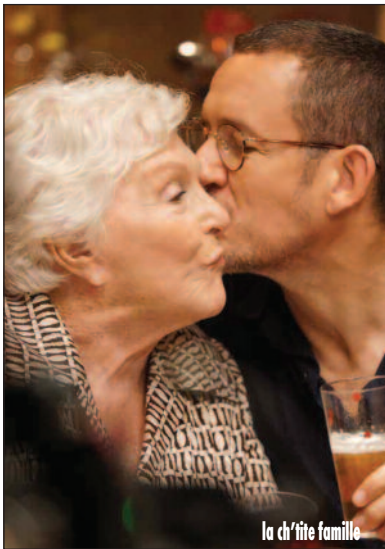
la ch'tite famille