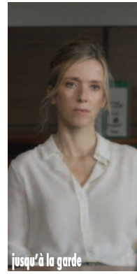
jusqu'à la garde